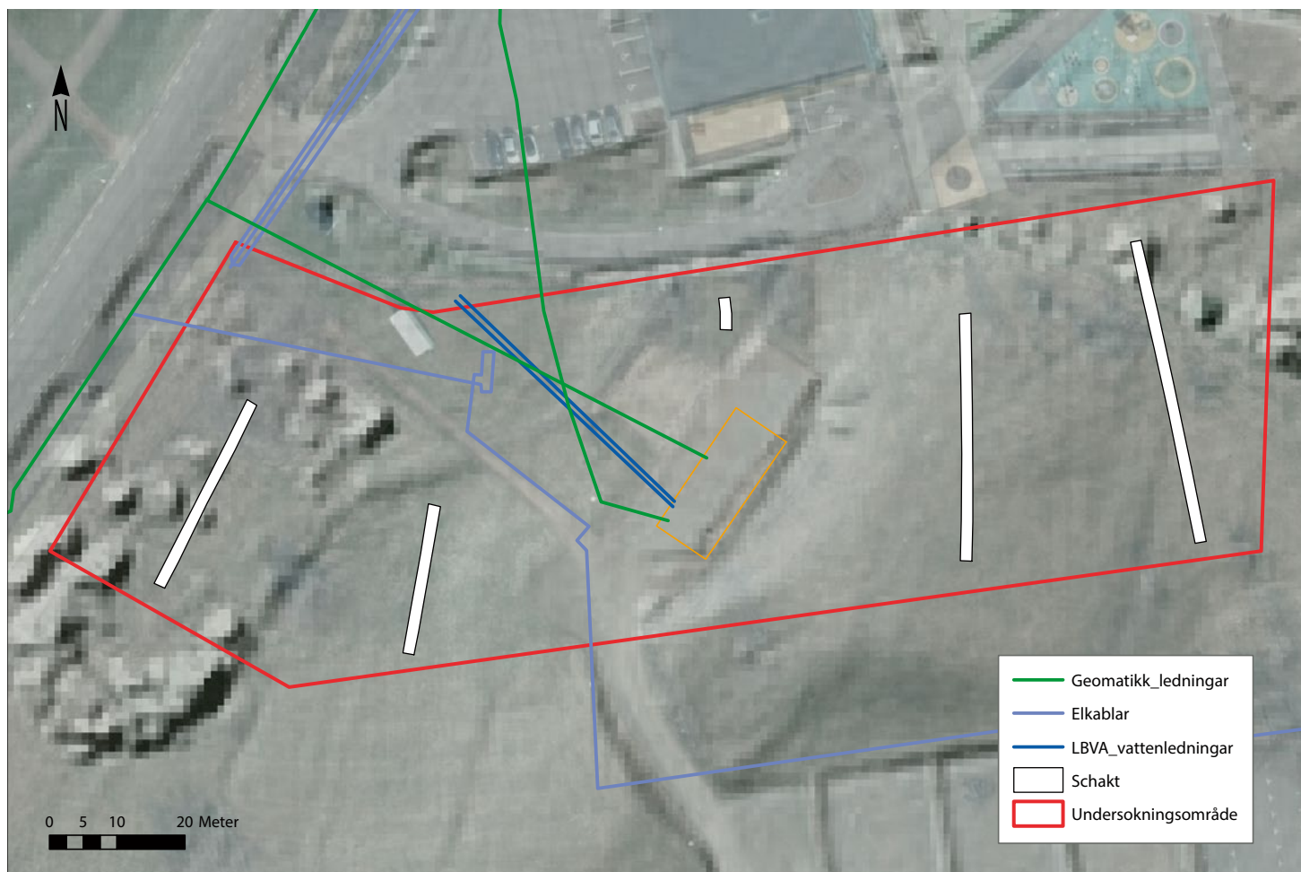
Figur 2. Undersökningsområdet med alla schakt samt störningar. Skala 1:700.